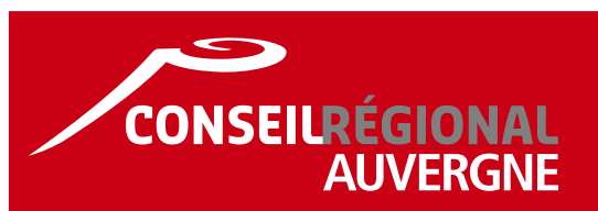
Cartouche rouge, sur fond clair